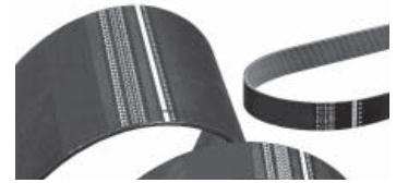
Profil Section PL